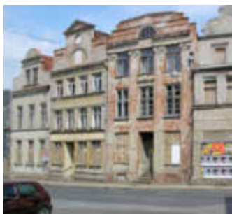
Am Berge 10 - 12, vorher