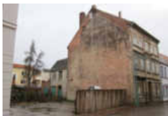
Lange Straße 4 - 5, vorher