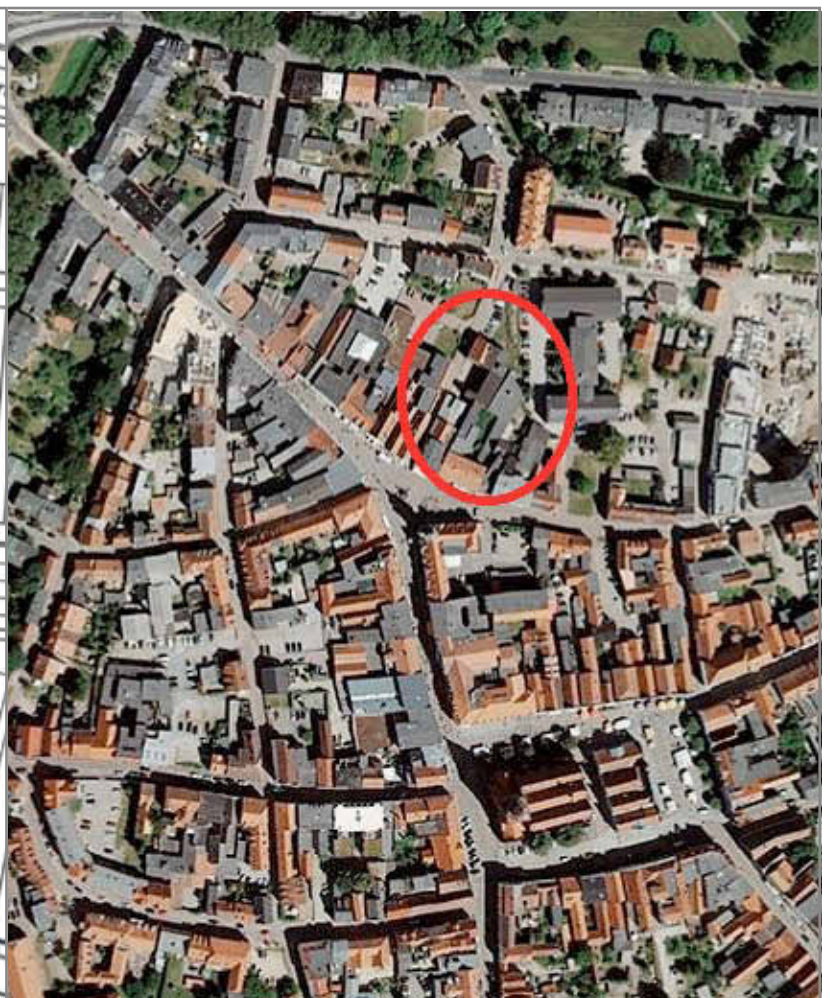
Lageplan - Grundstück Pferdemarkt 39, Güstrow